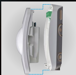
Előlről felpattintható, teljesen tömített elektronika és fedél

Pörgesse fel a telepítés menetét, töltsön kevesebb időt a bekötéssel! A Capture tervezése telepítői szemlélettel történt és sok, telepítőbarát részlettel szolgál. Gyors haszon realizálása a szerelésen és a bekötésen? Sima ügy!