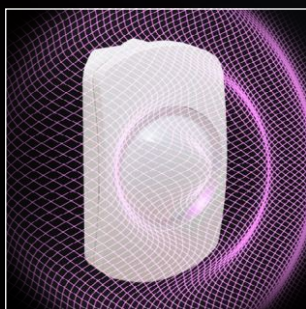
Kiemelkedően precíz mikrohullámú érzékelés