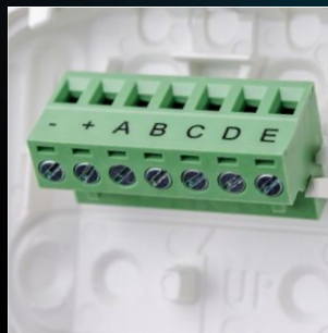
Szerszám nélkül eltávolítható, billenthető kapocsor