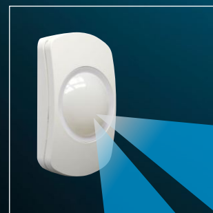
Továbbfejlesztett maguk alá látó zónák