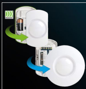
Grade 2 besorolás, valamint rádiós kivitelek