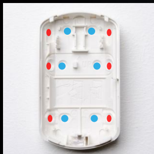
Számos furat- és kábelelőkészítés, a falra rögzítéshez